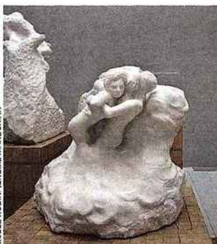
MUSÉE RODIN/JÉRÔME MANOUKIAN